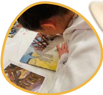
PEINTURE À L'HUILE