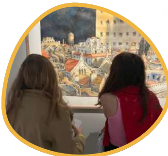
VISITE AU MUSÉE