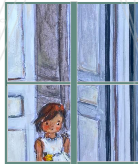
«LES AVENTURES D'HENRI MATISSE»

ACTIVITÉS AU CHOIX : peinture ou sculpture