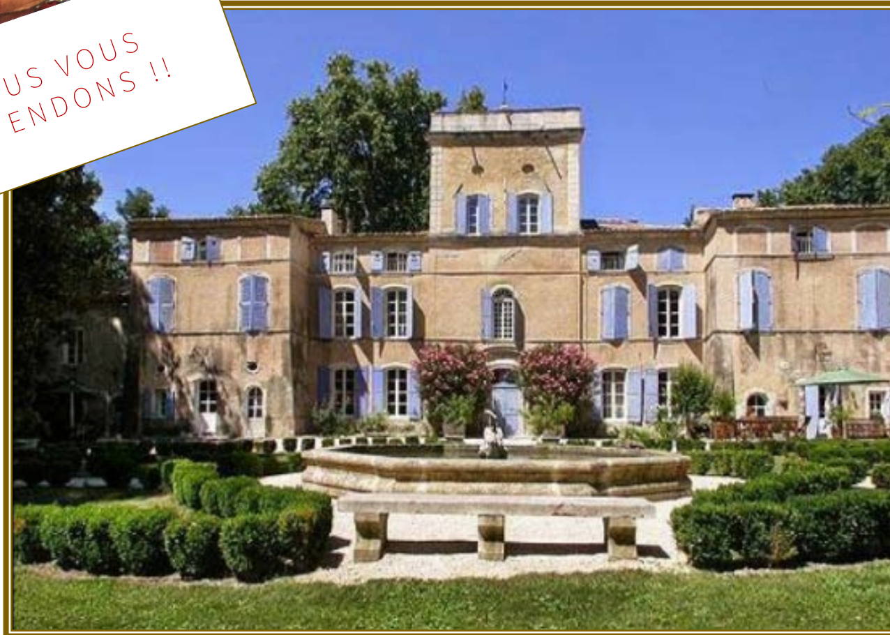
Château des Barrenques, 6 Quartier des Barrenques, 84840 Lamotte-du-Rhône Coordonnées GPS : 4°40'23" E - 44°17'06" N